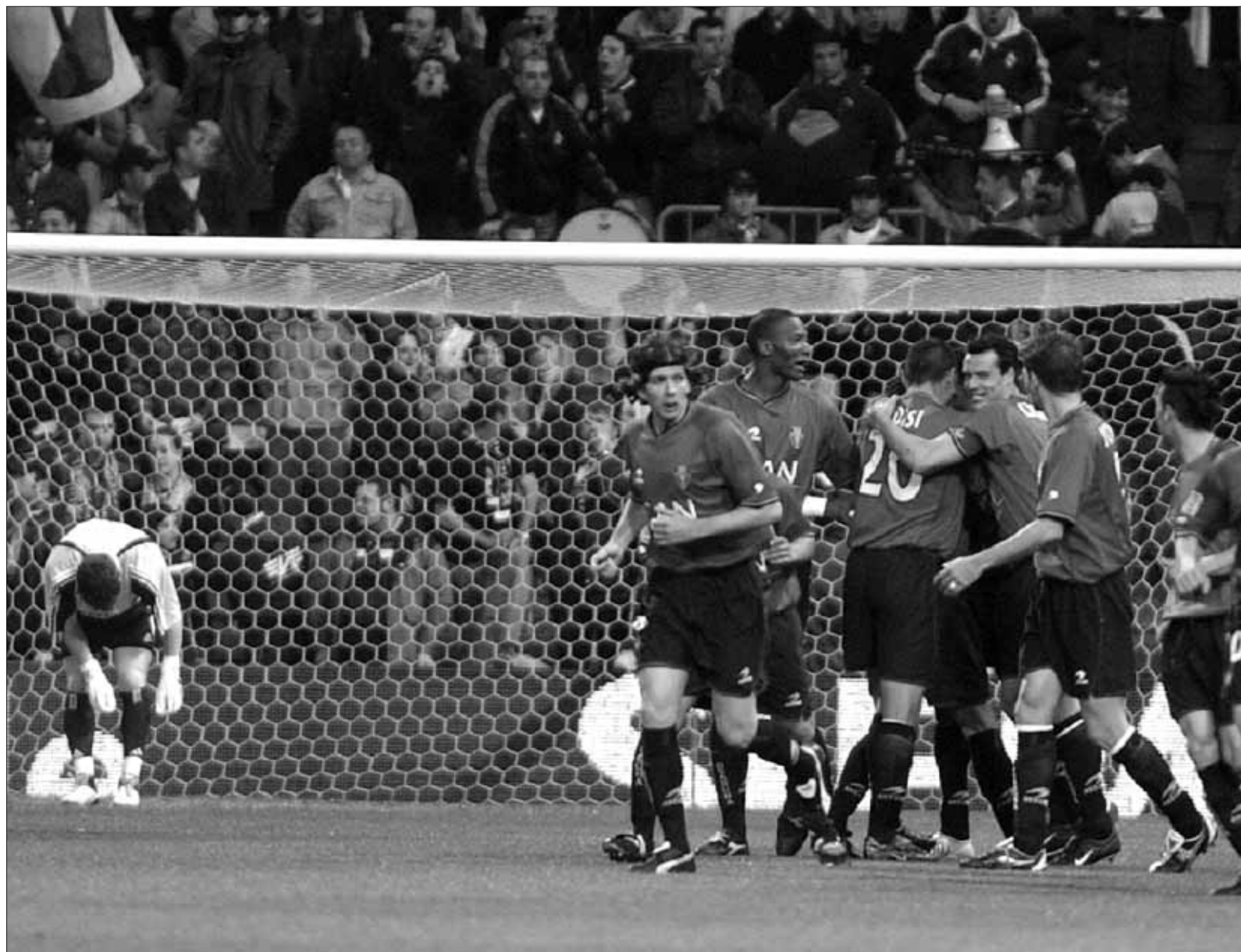
Los navarros celebran eufóricos su triunfo ante la desolación de Iker Casillas. Los merengues sufrieron una nueva debacle tras su dolorosa eliminación europea en Mónaco

La debacle de Mónaco pesó más de lo previsto a un Real que salió derrotado de antemano. Al minuto de juego, Valdo ya puso en ventaja a su equipo. La jugada, de patio de colegio, nació de un saque de banda del lateral izquierdo Antonio López, Salgado y Raúl Bravo se estorbaron al intentar despejar, el balón le cayó a Aloisi, quien le